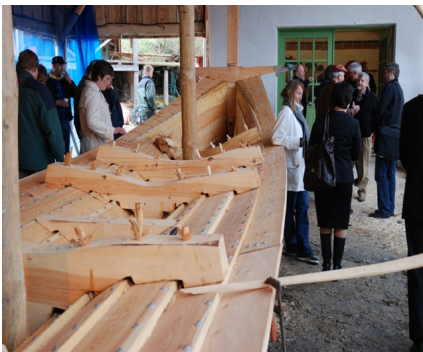
MOTIV: UTVANDRERFEST

Den 30 april ble det holdt en stor utvandrerfest på Finnøy i anledning SR-Banks sjenerøse sponsorgave på 3 millioner kroner til stiftelsen.